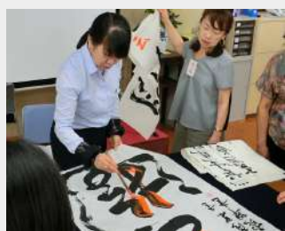
漢字・かな、どの作品にも対応します！

題材の選び方や字体の正確さ、作品全体のまとめ方など、押さえておくべき大切なポイントを、わかりやすく丁寧に指導します。作品づくりに挑戦してみませんか。